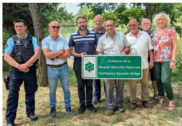
Les Maires et représentants des mairies autour du Président du SICOVAL, en présence du Major de la Gendarmerie de Castanet

rnr-confluence-garonne-ariège.fr ou contact@rnr-confluence-garonne-ariège.fr